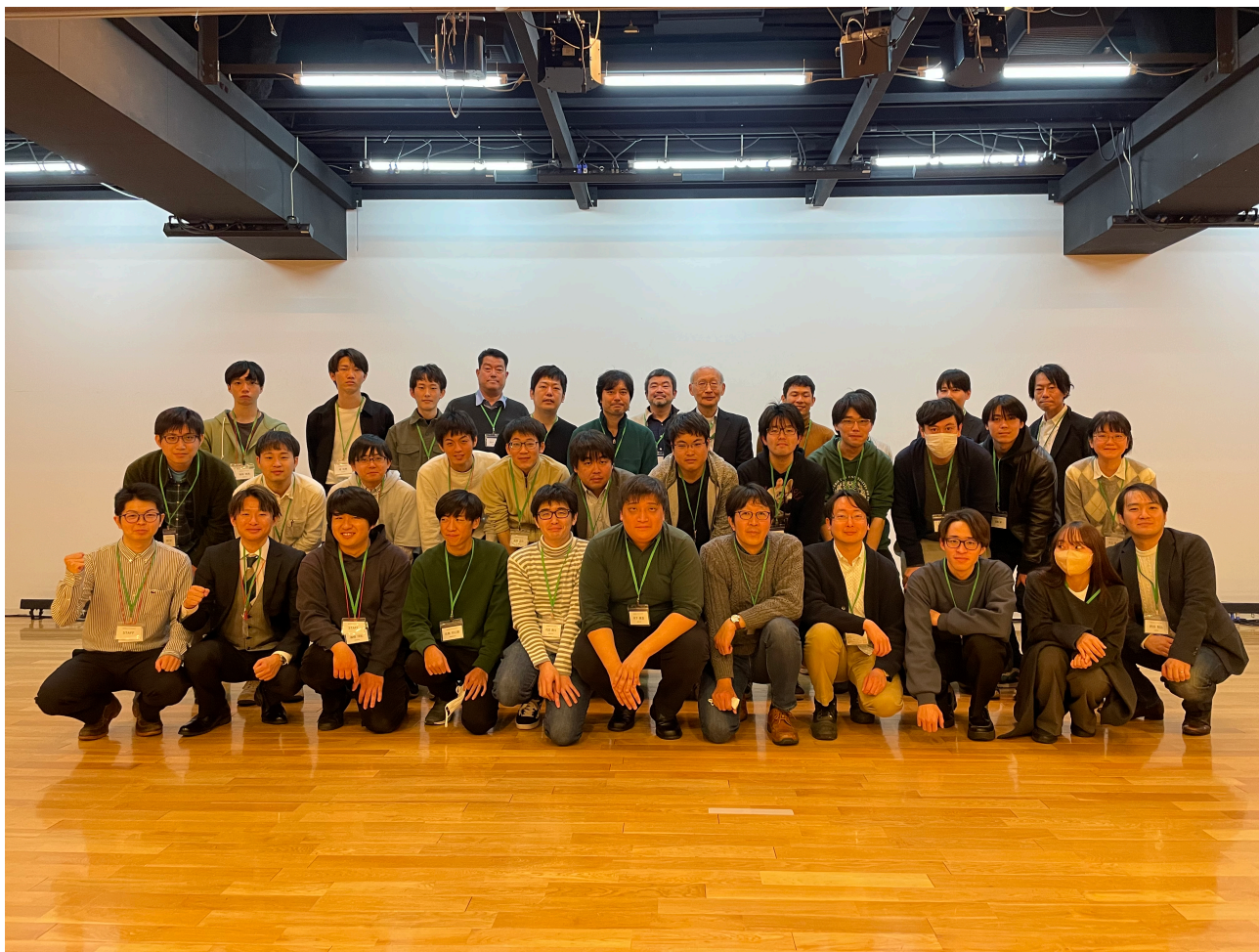
図1 OSD2023 参加者

(13:10 開場) 13:25-13:30 OSDの趣旨説明 13:30-14:45 第1セッション トピックの決定と説明 (15分程度) グループディスカッション (50分程度) 情報共有 (10分程度) 14:45-14:55 休憩 14:55-16:25 第2セッション トピックの決定と説明 (30分程度) グループディスカッション (50分程度) 情報共有 (10分程度) 16:25-16:30 総括